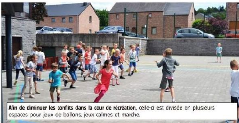
Afin de diminuer les conflits dans la cour de récréation, celle-ci est divisée en plusieurs espaces pour jeux de ballons, jeux calmes et marche.

la cour de récréation est désignée par la majorité des élèves comme l'endroit principal d'expression de la souffrance psychosociale vécue en milieu scolaire. C'est là que la plupart des conflits ont lieu et il est donc nécessaire de penser ces cours de récréation afin de réduire le risque de problèmes. C'est cette raison qui a poussé la direction de l'école à maîtriser l'espace récréatif en réorganisant son fonctionnement en fonction de règles précises.